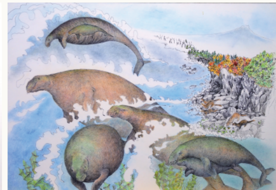
浩而魅諭 <カイギュウ>