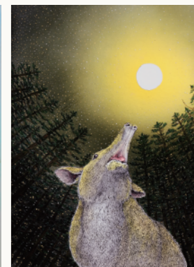
浩而魅諭 <プレシオコロピルス>