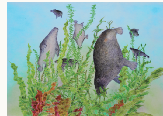
浩而魅諭 <デスマスチルス>

7月27日(土)実施の絵画ワークショップ、およびトークイベントは事前予約が必要です。ご予約は、沼田町化石体験館の受付窓口、またはお電話にて承ります。 募集期間 / 7月5日(金)～7月25日(木) 電話番号 / 沼田町教育委員会：0164-35-2132 (月曜日 9:00～17:00、平日 15:30～17:00) 沼田町化石体験館：0164-35-1029 (火～日曜日 9:30～15:30)