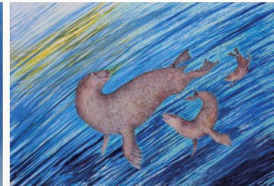
浩而魅諭 <アロデスムス>