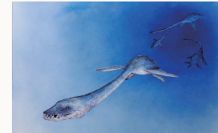
浩而魅諭 <ホベツアラキリュウ>