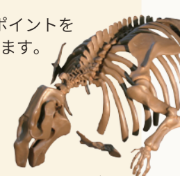
ヌマタカイギュウ

『北海道絶滅動物館』で紹介されている沼田の化石たちを、担当学芸員が紹介します。 日時 / ①8月3日(土) 11:30～ ②8月4日(日) 11:30～ ③8月11日(日) 11:30～ ④8月12日(月・祝) 11:30～ 料金 / 無料 場所 / 沼田町化石体験館